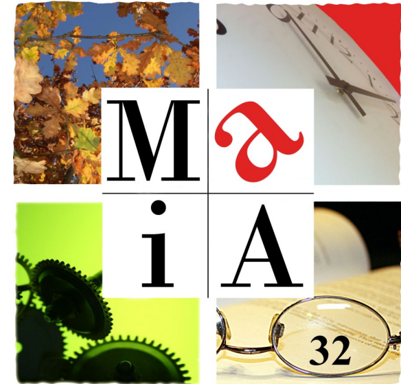
Maison pour l'Autonomie et l'Intégration des malades d'Alzheimer

L'équipe MAIA 32, 1 rue Marcel Luquet ZI Engachies, 32000 Auch :